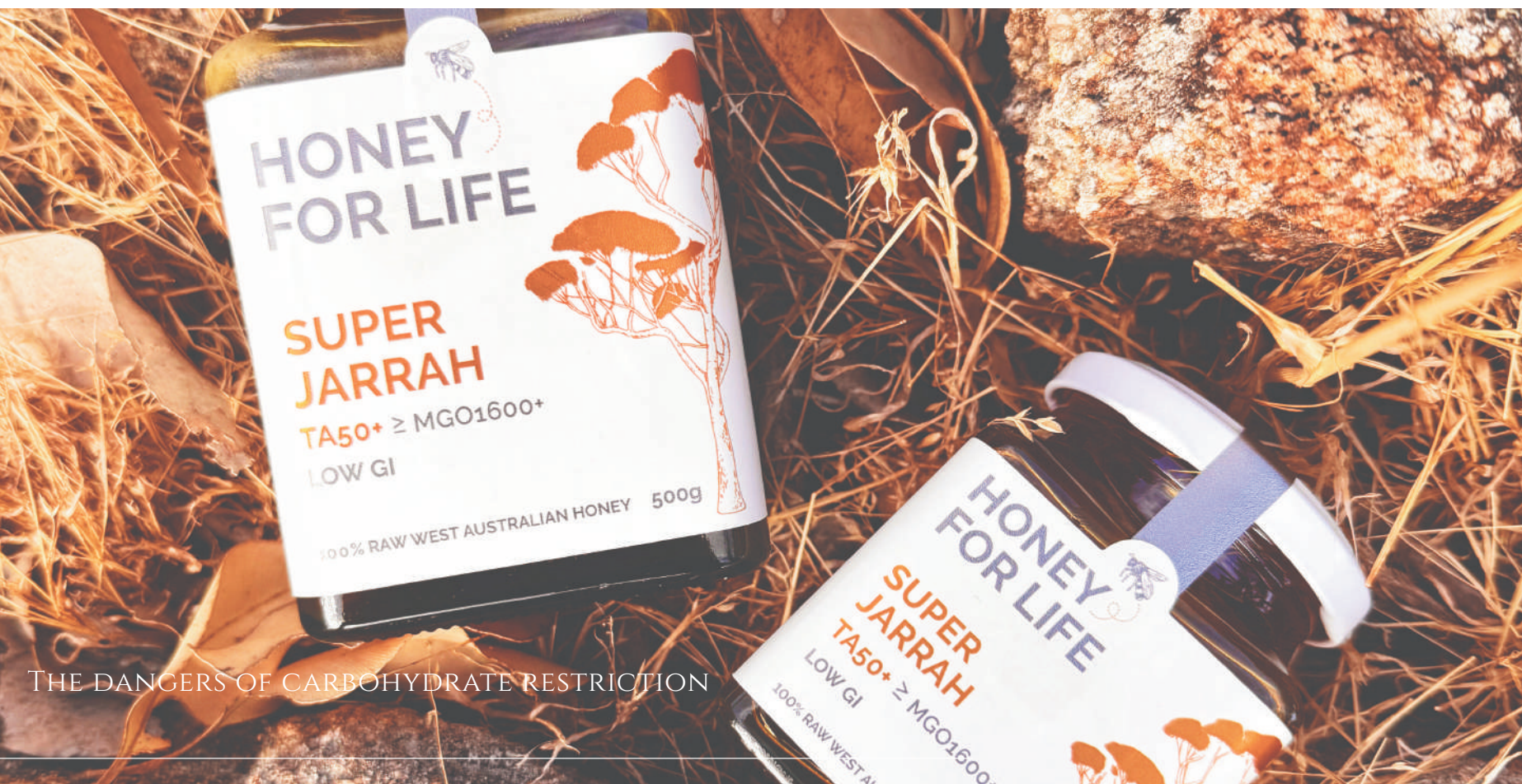
THE DANGERS OF CARBOHYDRATE RESTRICTION