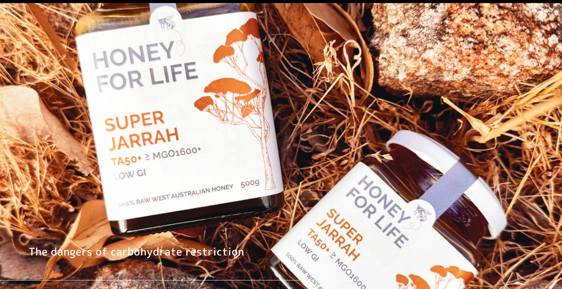
The dangers of carbohydrate restriction

糖が不足すると身体は非常事態（飢餓モード）に入り、 体重が減ってもそれは「痩せた」ではなく身体が「削れた」状態です。 代謝は落ち、食べていないのに太りやすい体になります。 さらに脂肪を主なエネルギーにすると、老化を進める物質が生まれ、 肌は乾燥・たるみ・シミの原因に、髪は抜け毛・薄毛・質の低下に、爪は割れ・縦筋など、 見た目の老化や不調を招きやすくなります。